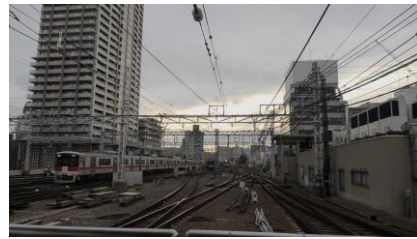
山陽 5000 系 直通特急 姫路行き