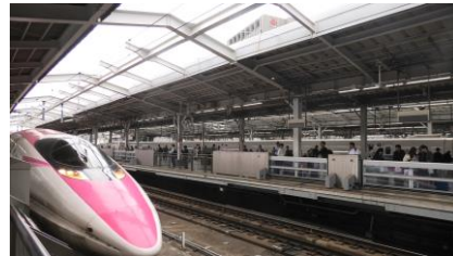
20 番線に入線するこだま 942 号 折り返しこだま 949 号に なります