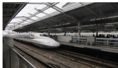
のぞみ129号 博多行き