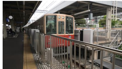
阪神 8000 系 特急 大阪梅田行き