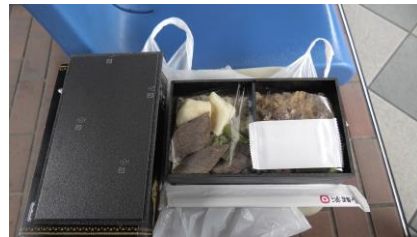
右側にすきやきが、 左側にステーキがのっています。