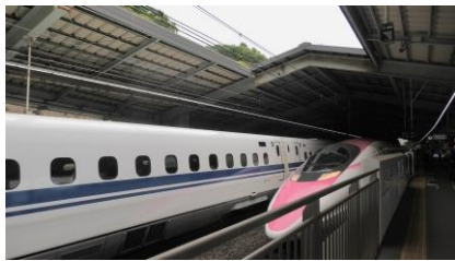
新神戸駅を発車する ハローキティ新幹線