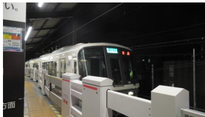
221 系 大和路快速 奈良行き

西九条駅から天王寺駅までは大和路快速に乗車しました。 天王寺駅からは関空快速に乗車して、帰宅しました。