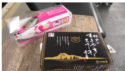
先述の 神戸のすきやきと ステーキ弁当と 今回いただく 500系 ハローキティ新幹線 弁当