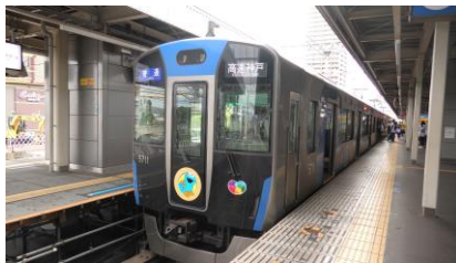
5700系 「COOKIE MONSTER's MOGUMOGU TRAIN」