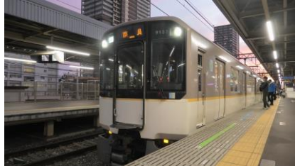
近鉄 9020 系(前 2 両) 快速急行 近鉄奈良行き 後ろに 5800 系 6 両を併結

尼崎駅から近鉄 9020 系+5800 系の快速急行に乗車して、西九条駅に向かいます。