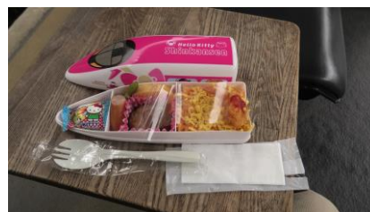
中はお子さまが喜びそうな メニューで チキンライス、エビフライ、 ハンバーグ、ウインナー、 玉子焼き、枝豆、マシュマロが 入っています。

なお、写真に写っている、神戸のすきやきとステーキ弁当は後ほどおいしくいただきました。