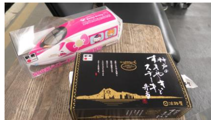
神戸のすき焼きとステーキ弁当 (¥1,480) (※奥のお弁当は別店舗で購入)