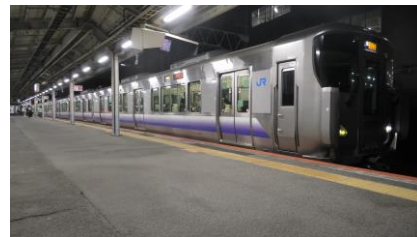
225 系 5000 番台 関空快速 関西空港行き