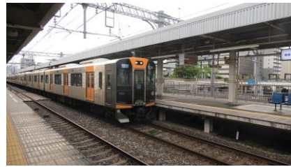
阪神 1000 系 快速急行 近鉄奈良行き