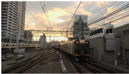
阪神 1000 系(ラッピング) 急行 大阪梅田行き