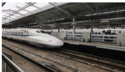
のぞみ63号 広島行き

500系 ハローキティ新幹線が到着するまで時間があるため、 少し撮影をしました。