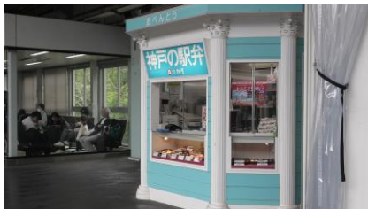
「淡路屋」の売店 (新大阪・東京方面のホーム)