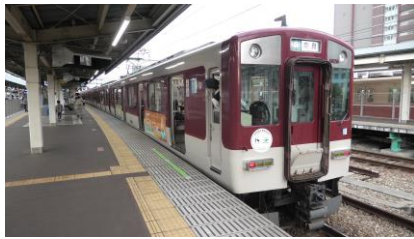
近鉄 1026 系(ラッピング) 快速急行 近鉄奈良行き

近鉄には、阪神なんば線を介して快速急行が神戸三宮始発で大和西大寺や近鉄奈良まで、準急、区間準急、普通が尼崎始発で東花園(普通のみ設定)、大和西大寺、近鉄奈良まで乗り入れています。