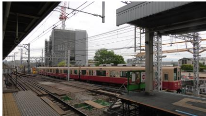
8000系 「ELMO's HAPPY TRAIN」

尼崎駅でセサミストリートのラッピングが施されている車両に出会いました。 8000系にはエルモのラッピングが、 5700系にはクッキーモンスターのラッピングが施されています。