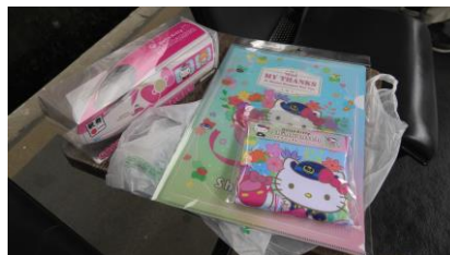
THANKS ART を使用した グッズを購入しました。