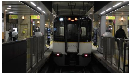
近鉄 5820 系 快速急行 近鉄奈良行き

神戸三宮駅始発の近鉄奈良行き快速急行に乗車すれば乗り換えなしで移動できますが、後の特急に尼崎駅まで乗車することにしました。