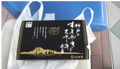
神戸のすきやきとステーキ弁当