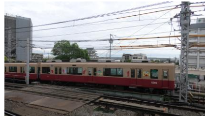
ラッピングは 先頭の車両に施されています