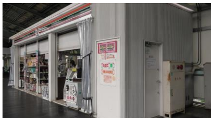
セブンイレブン キヨスク JR 新神戸 2 番のりば東店